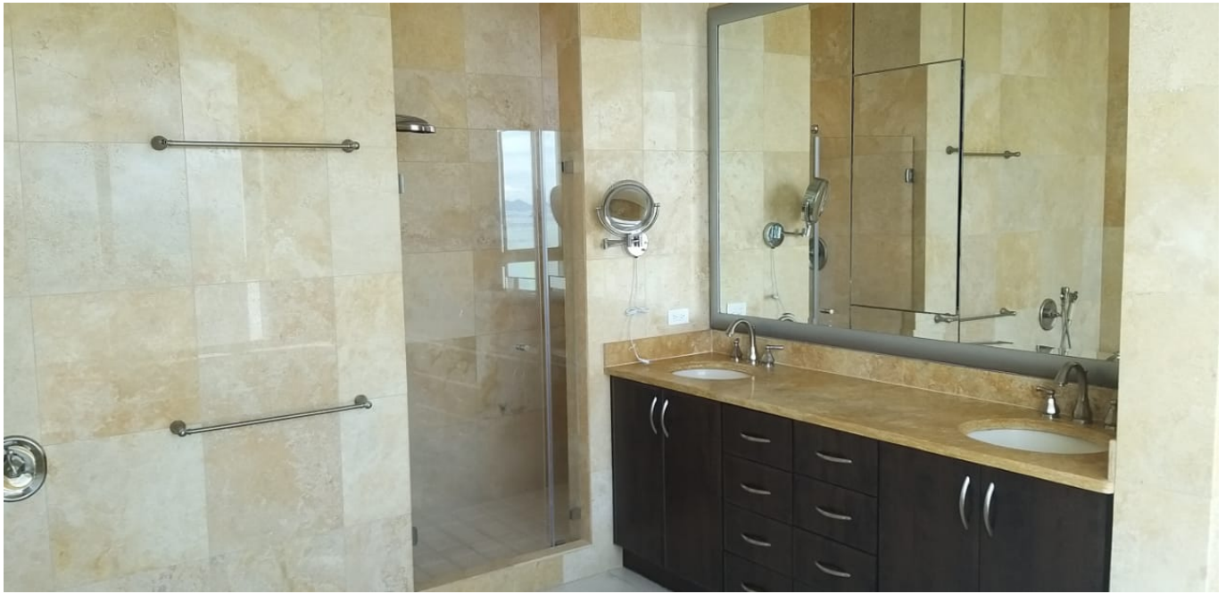
PENTHOUSES TÍPICOS DE 415 mts2 Nivel 41 a 52