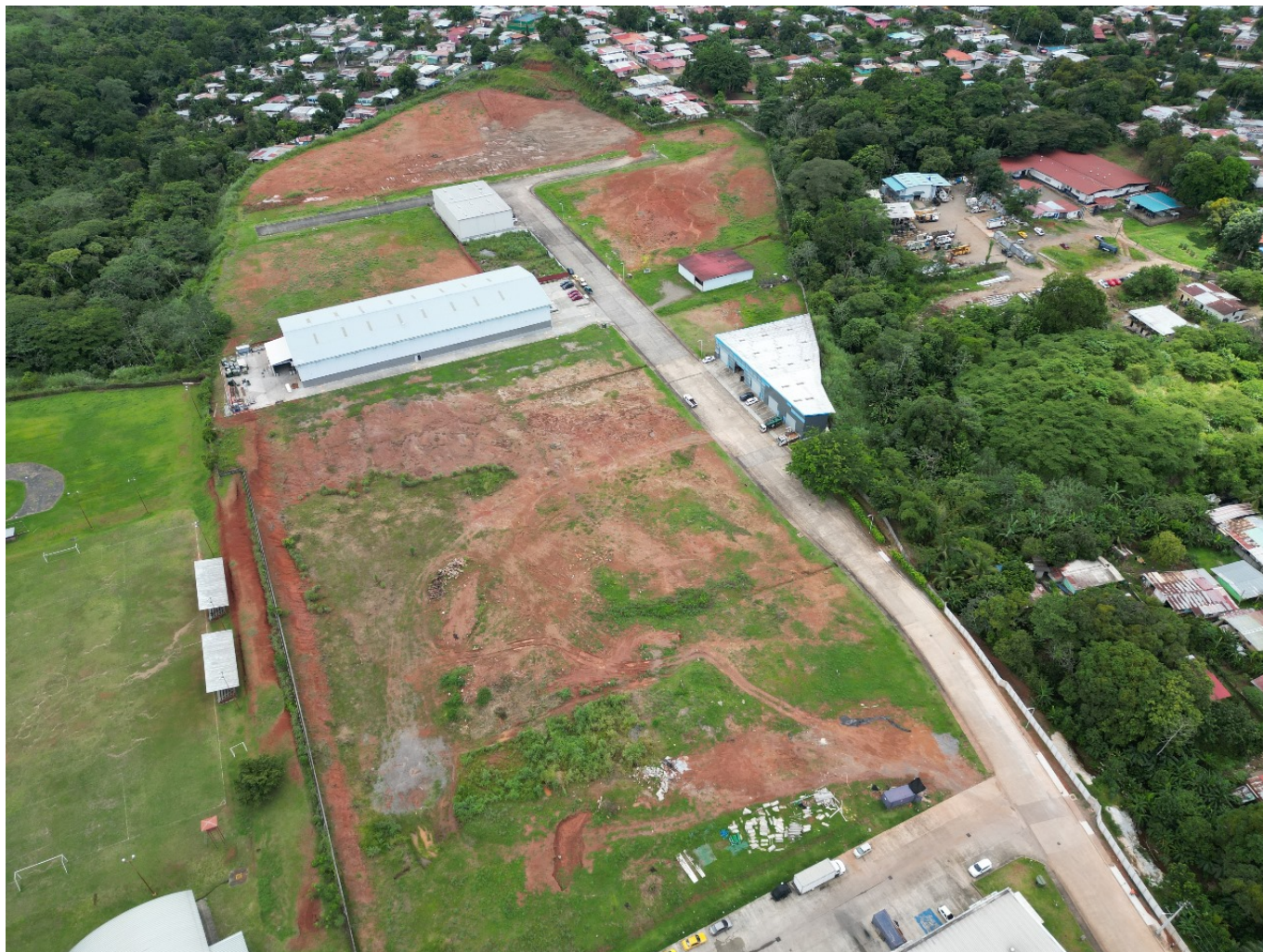
lote de 13,517m2