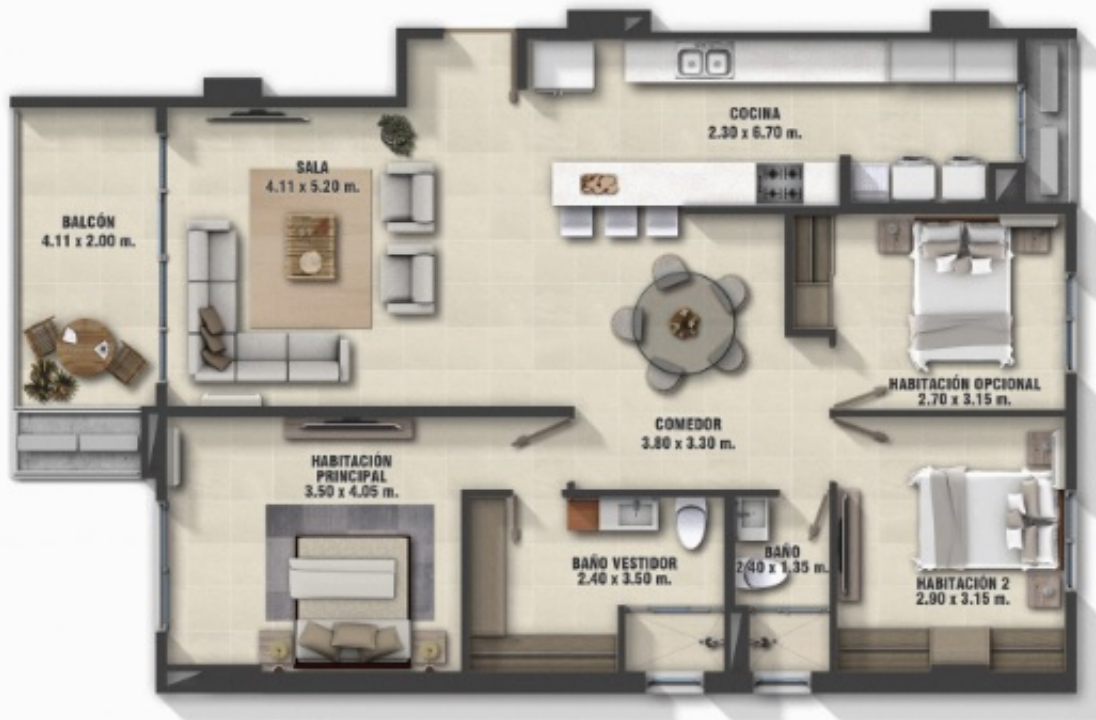
Apartamento de 121.99 m 2