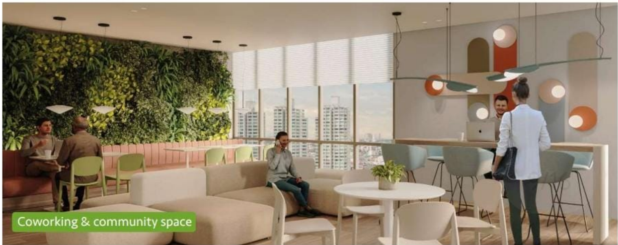
Coworking & community space