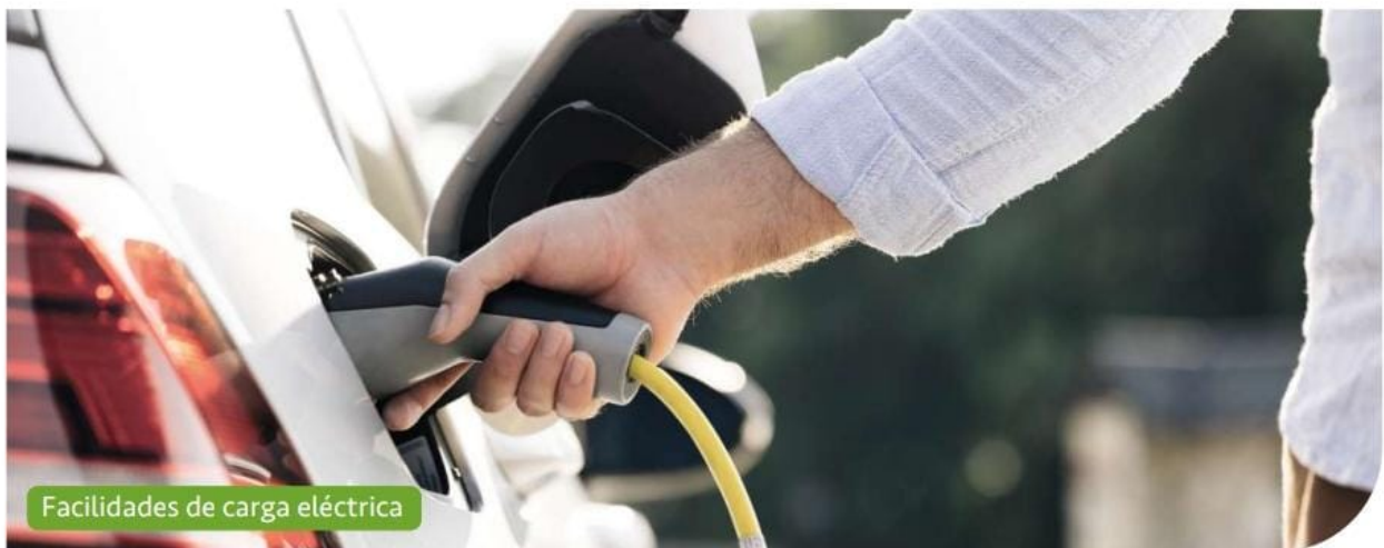
Facilidades de carga eléctrica