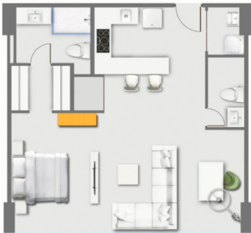
MODELO A - APARTAMENTOS 3, 4, 5 Y 8 - 70M2