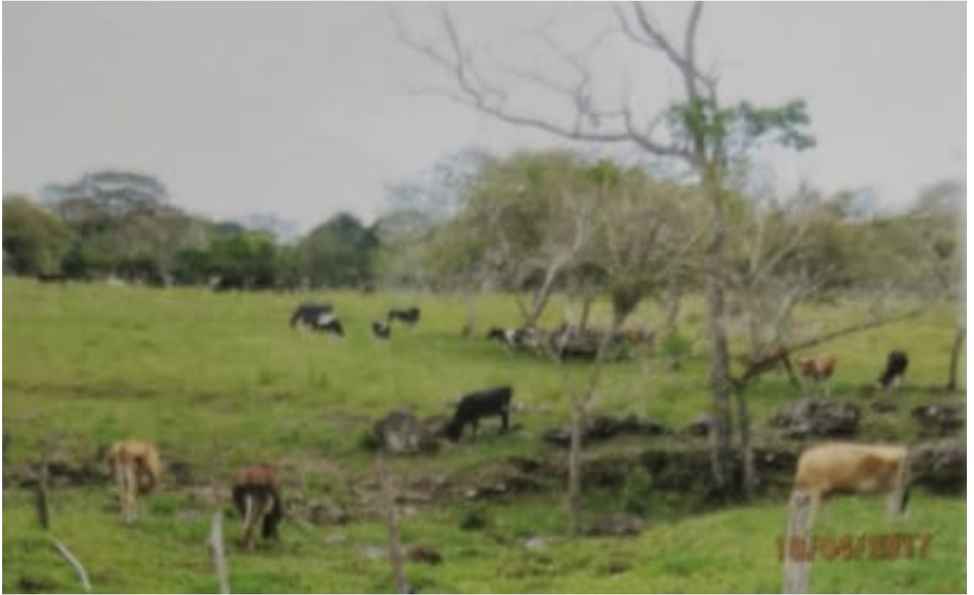
Globo de terreno