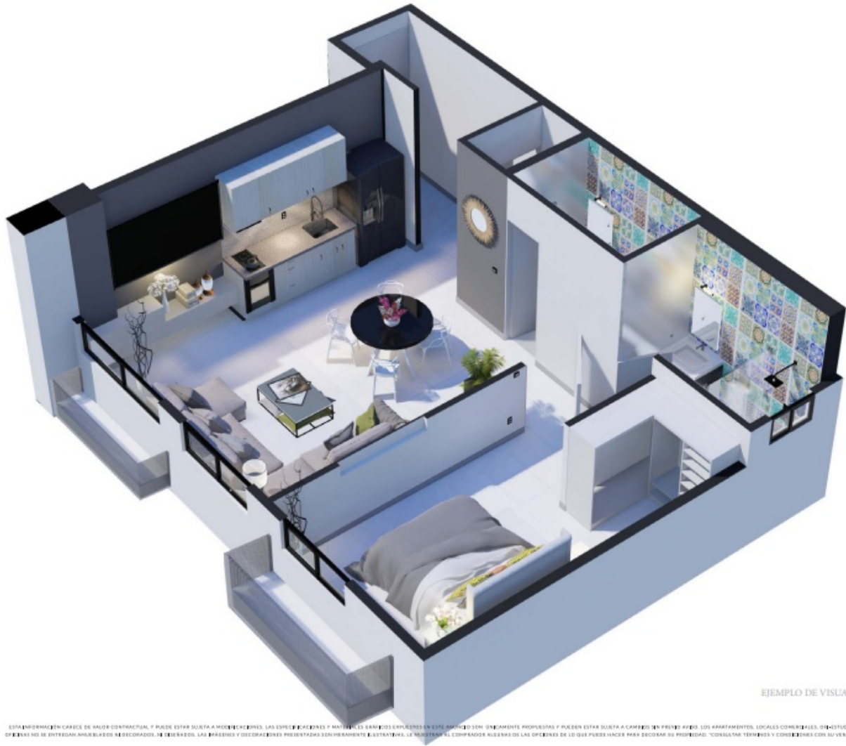
EJEMPLO DE VISUALIZACIÓN 1

ESTA INFORMACIÓN CARECE DE VALOR CONTRACTUAL, PUEDE ESTAR SUJETA A MODIFICACIONES. LAS ESPERANZAS Y MATERIALS SEÑALADOS EN ESTE APARTAMENTO SON ÚNICAMENTE PROPUESTAS Y PUEDEN ESTAR SUJETA A CAMBIOS EN PRÓXIMO AÑO. LOS APARTAMENTOS, LOCALES COMERCIALES, OFICINAS Y OTROS NO SE ENTREGAN AMUEBLADOS NI DECORADOS. LAS BRANDES Y DECORACIONES PRESENTADAS SON MERAMENTE ILUSTRATIVAS. LE MOSTRAMOS AL COMPRADOR ALGUNAS DE LAS OPCIONES DE LO QUE PUEDE HACER PARA DECORAR SU PROPIEDAD. CONSULTAR TÉRMINOS Y CONDICIONES CON SU VENDEDOR.